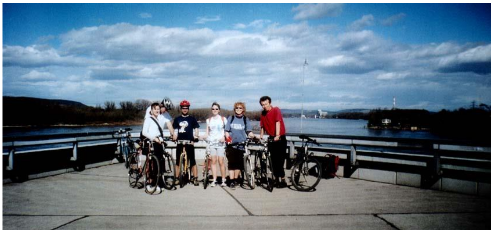
Велосипеден излет край Дунава с колеги

Манастирите, споменати по-горе, се наричат „Щифт“ – „дарение“ (оттам извънредно полезната дума „Щифтунг“, т.е. фондация), тъй като са дарени на църквата от знатни покровители. За тях – виж и < www.melk.at >, < www.duernstein.at >, < www.stiftgoettweig.at >.