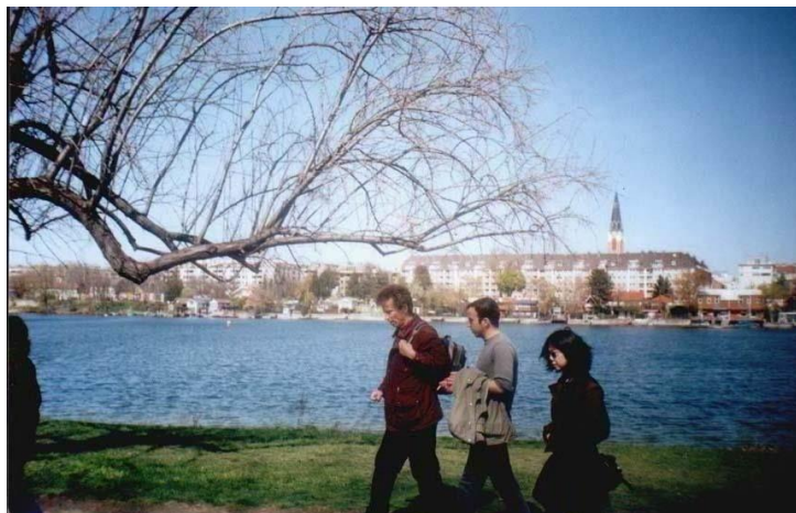
Разходка с колеги край Дунава