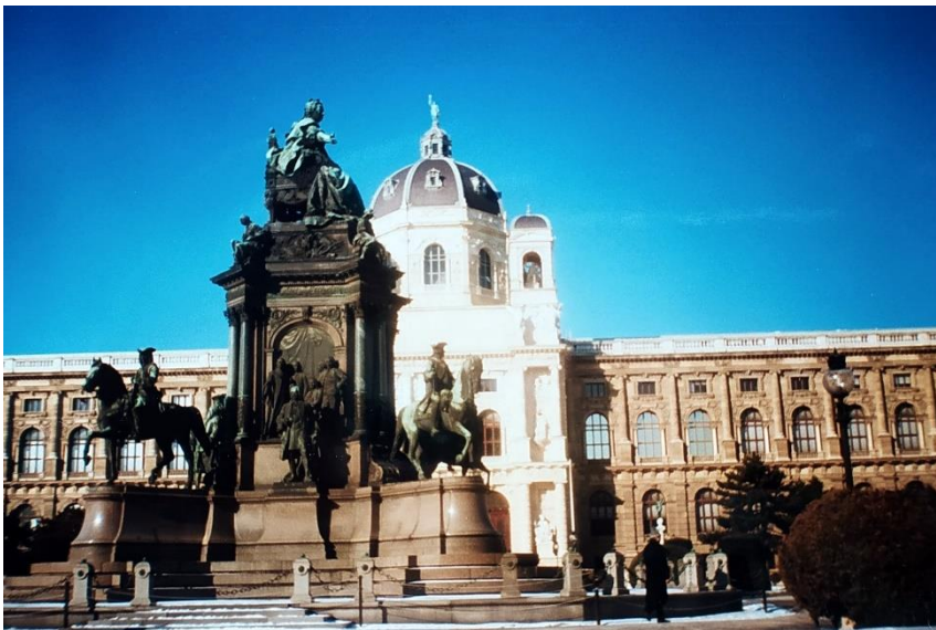
Паметник на императрица Мария Терезия (1745–1765)

Сицилианецът имаше рожден ден на 25 февруари и от любов към авантюрите и към една унгарка реши да го празнува в Будапеща. Първия ден времето бе гадно, но вечерта се насладихме на тукашните по-достъпни от австрийските кръчми и кафенета. Особено ми хареса един покрит с платнище двор, където горяха мощни газови горелки, имаше удобни столове и джаги – въобще напомняше Валхала (според Р. Вагнер). Сладкото унгарско вино също ми допадна. Втората вечер ношувах в общежитието на Централноевропейския университет. Добре ми дойде сауната там след голямото ми намръзване в ледената нощ горе на крепостта. Отбих се и до самия университет. На ул. „Надор“ посетих Медиевистиката. В много прекрасно място си учил – палат, евтино барче... Като природа Будапеща ми хареса повече от Виена, Музеят на земеделието е приказен замък, Площадът на героите също е по-добър от виенския. Като удобство и чистота обаче тук във Виена си е по-добре, пък и разбирам какво ми говорят.