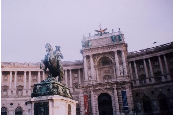
Статуята на победоносния принц Евгений (Ойген) Савойски (1663–1736)