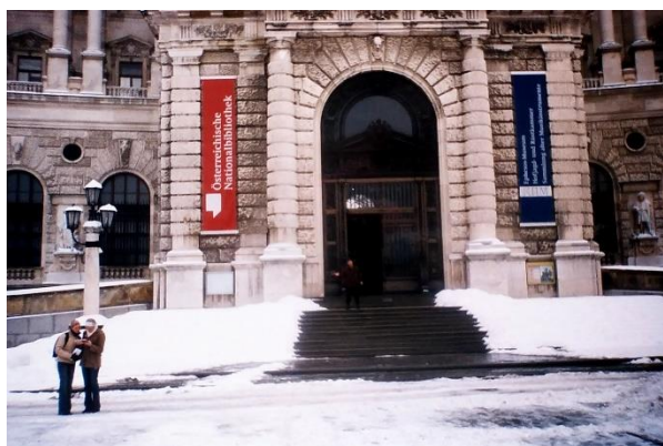
Австрийската национална библиотека (Österreichische Nationalbibliothek), разположена в двореца Хофбург