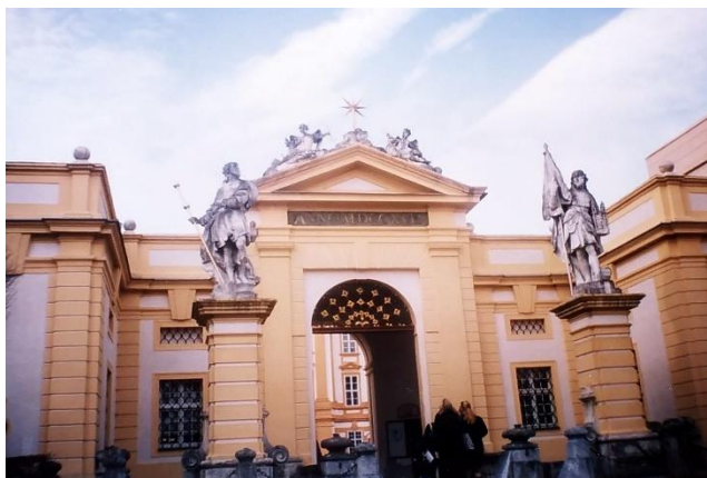
Бенедиктинският манастир Мелк

1. Мелк е огромна сграда върху хълм, боядисана в „Шьонбрунско жълто“. Влиза се по алея, заобиколена от борчета с барокови фризури. Посрещна ни статуята на св. Коломан – някогашния покровител на Niederösterreich (Нидеростеррайх, провинцията около Виена). Във вътрешния двор слънцето огряваше 2 от