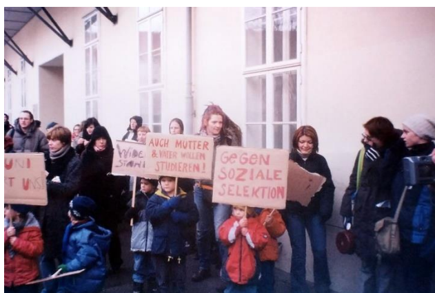
Студентски протест за подобряване на социалните условия

или шоколад с лешници 100 гр. струват 0,35 €; натур. сок и млякото литър е 0,70 €, банани и портокали са на нашите цени; но пък хлябът е 0,75 € кг., сиренето е към 5 €. В Испания едва ли е по-евтино. Има много евтини удоволствия – правостоящи билети за театър и опера по 1- 2 €. Намират се и АБСОЛЮТНО безплатни забавления като среща с поети в Българския култ. дом „Витгенщайн“ + шведска маса – ама рядко.