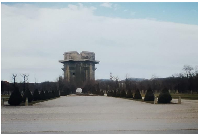
Зенитна кула от Втората световна война в парка Аугартен

Вчера измина точно 1 месец откак съм във Виена и реших да го отбележа достойно. Слънцето грееше пролетно и вместо да се завра в Библиотеката, аз възседнах закупения си от Бълха пазар за 55 € тайвански маунтинбайк с 21 скорости (всички работещи), предни амортизъри и алуминиева рамка. Обиколих центъра по велосипедната