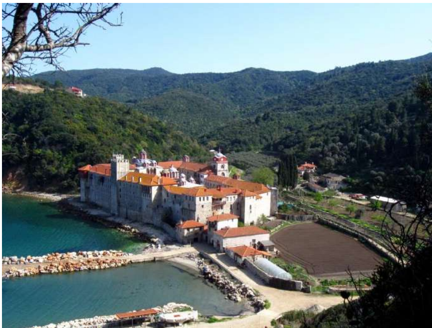
Бунтовната обител Есфигмен